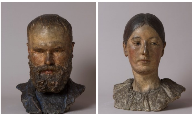
P.S. Krøyer: Portræt af maleren Michael Ancher , 1884. Bemalet gips