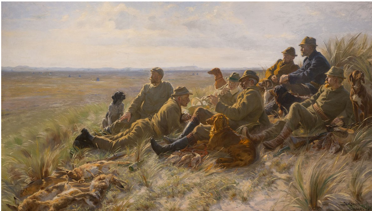
P.S. Krøyer: Skagensjægere , 1898. Olie på lærred. ARoS Aarhus Kunstmuseum.

Pasteller fra Anna Ancher til P.S. Krøyer