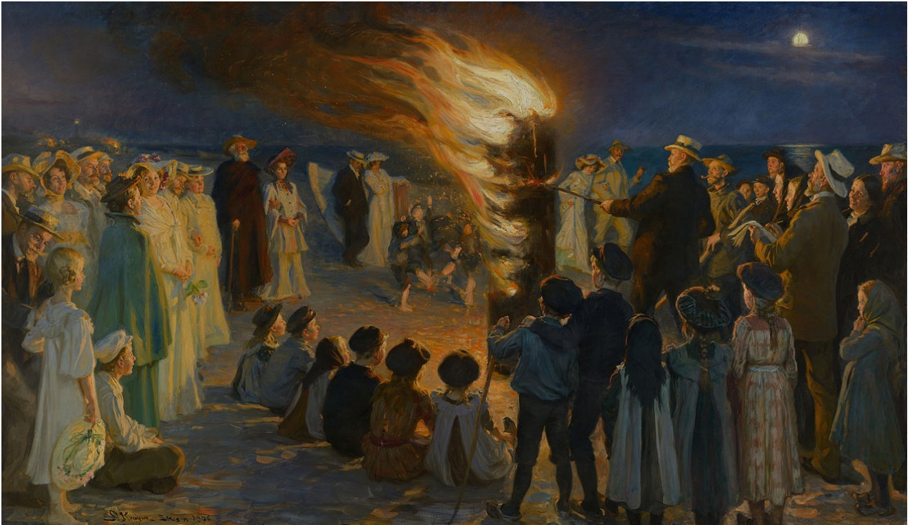
P.S. Krøyers store maleri Sankt Hansblus på Skagen strand fra 1906. Olie på lærred. Skagens Museum