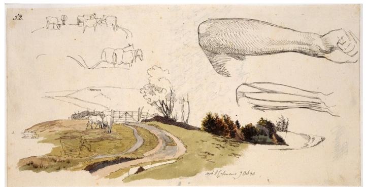
J. Th. Lundbye: Ved holmene m.m. 1840

Udstillingens tegninger præsenterer ikke blot spring i tid og rum, da vi tager med kunstneren rundt i Danmark og Italien. De rummer også mange eksempler på, at der inden for den samme tegning gemmer sig et helt univers. I tegningerne udnyttede Lundbye ofte papiret på flere ledder og kanter. I udstillingen kan man se knap 80 tegninger af Lundbye fra museets samling. En række af værkerne kommer til at hænge højt på væggen. Derfor har vi forsynet rummet med en stige, så man kan gå på opdagelse i Lundbyes fortællende univers, og komme helt tæt på værkerne.