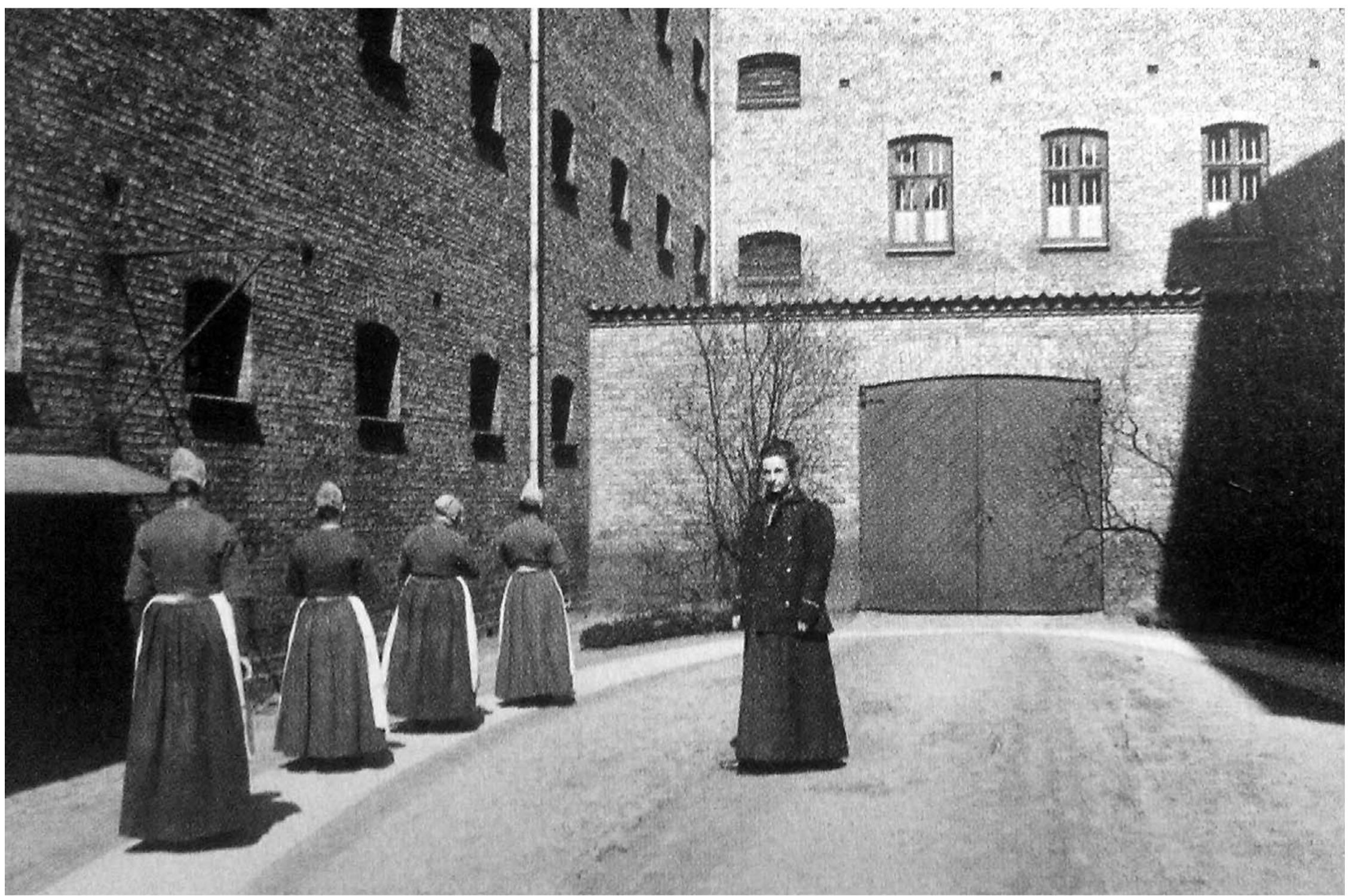
GÅRDTUR. Barnemordersker i fængsel måtte ikke tale sammen, og på gårdture skulle de holde afstand. Tankegangen var, at total ensomhed kunne opdrage fangerne til retsrafne mennesker. Foto: Peter Elfelt, 1909/Det Kgl. Bibliotek

Pigen bag 1902-dommen om barnemord, Engeline, var en spinkel pige på 19 år, da hun blev gravid. Hun var opvokset i arbejderkvartererne på Vesterbro i Kø-