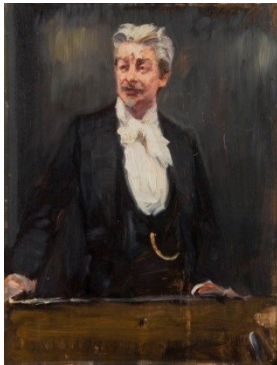
P.S. Krøyer: Portræt af Georg Brandes som foredragsholder . 1901.

Georg Brandes kritiserede samfundets gamle, etablerede værdier på talerstolen på Københavns Universitet i 1871, og