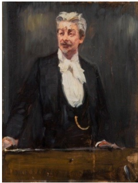
P.S. Krøyer: Portræt af Georg Brandes som foredragsholder . 1901.

Georg Brandes kritiserede samfundets gamle, etablerede værdier på talerstolen på Københavns Universitet i 1871, og