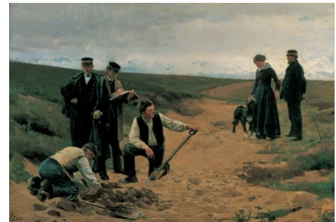
Erik Henningsen: Summum jus, summa injuria . Barnemordet . 1886.

Dette undervisningsforløb handler om det moderne, som gennembryder i den danske kunst i perioden 1870-1890, da industrialiseringen begyndte, arbejderklassen opstod, og hvor nye kønsroller og revolutionerende holdninger kom på dagsordenen. Underviseren går i dialog med eleverne om periodens ideologiske strømninger, kunstnerens valg af anderledes motiver og spændende, nye virkemidler. Vi skal tale om, hvordan man i samtiden reagerede på den nye samfundskritiske kunst, og hvordan vi opfatter den i dag. Afslutningsvist perspektiverer vi til i dag og diskuterer, hvad vi ville kritisere ved nutidens Danmark.